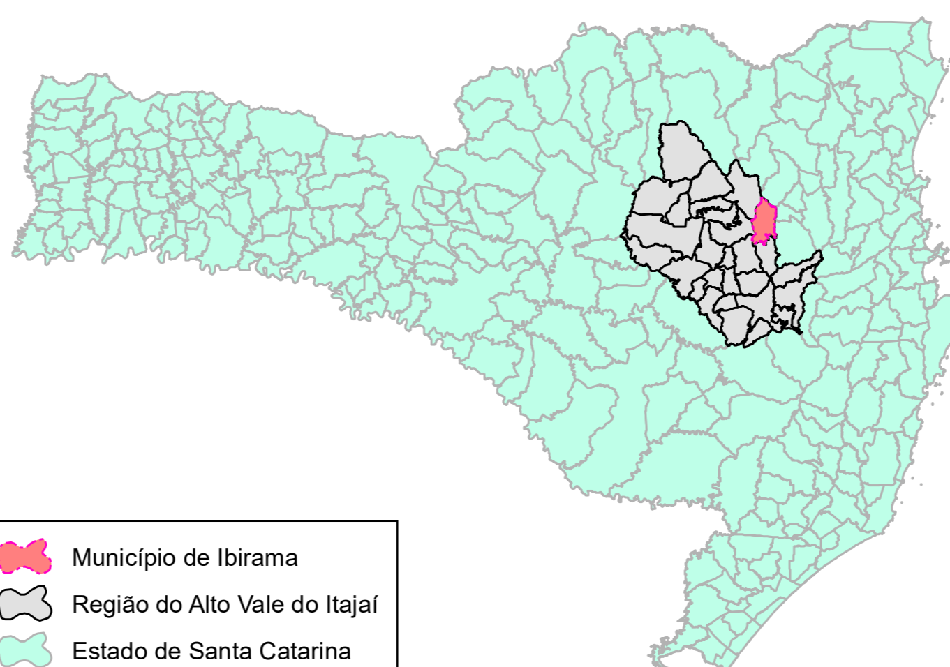
Mapa de Localização